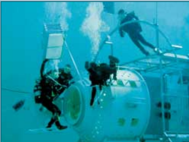
Die Astronauten werden mit den Systemen im Modul Columbus vertraut gemacht.