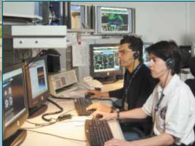
Internationale Crews trainieren im EAC für ihren Einsatz.